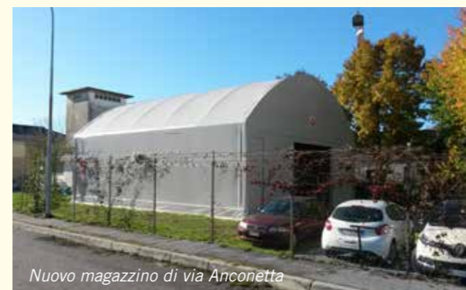
Nuovo magazzino di via Anconetta