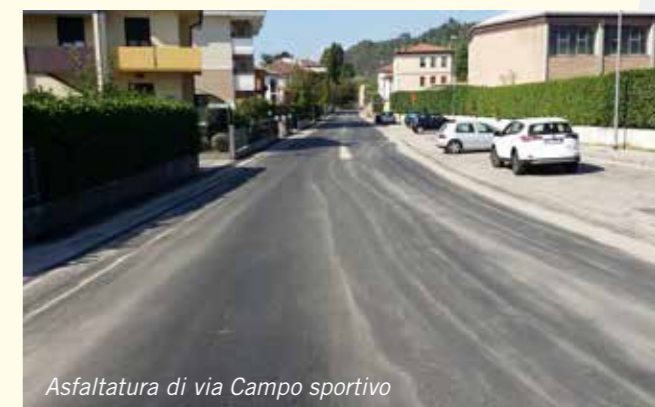
Asfaltatura di via Campo sportivo