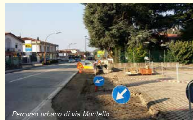
Percorso urbano di via Montello

Di seguito riportiamo una rassegna fotografica delle principali opere realizzate o in corso.