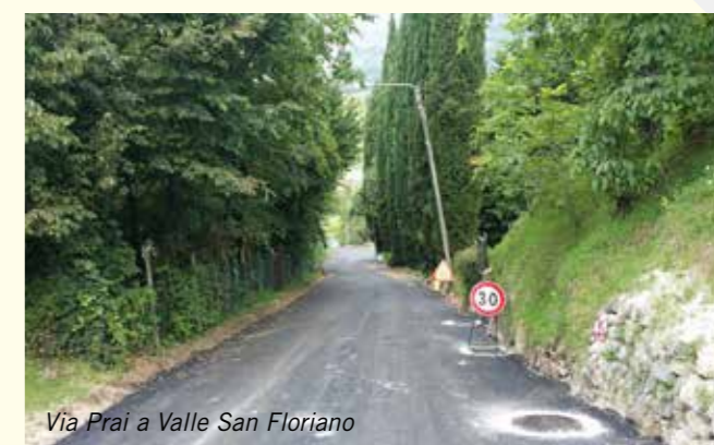
Via Prai a Valle San Floriano