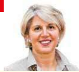
MARICA DALLA VALLE Sindaco