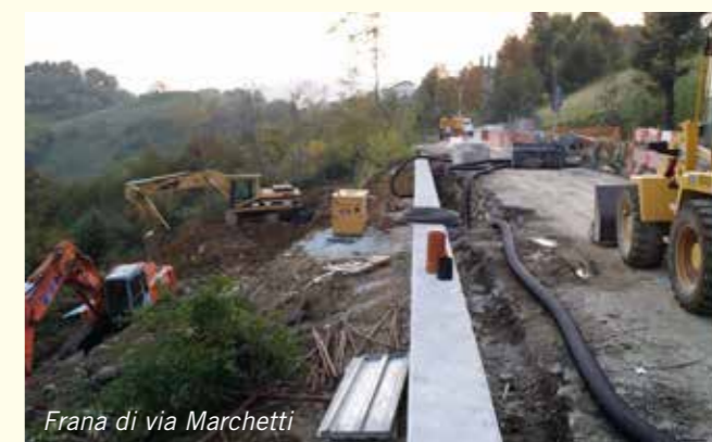
Frana di via Marchetti