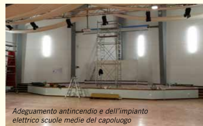
Adeguamento antincendio e dell'impianto elettrico scuole medie del capoluogo